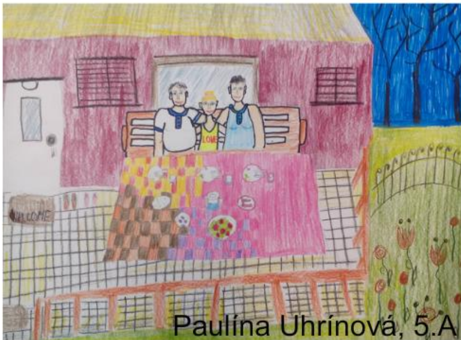
Paulína Uhrínová, 5.A