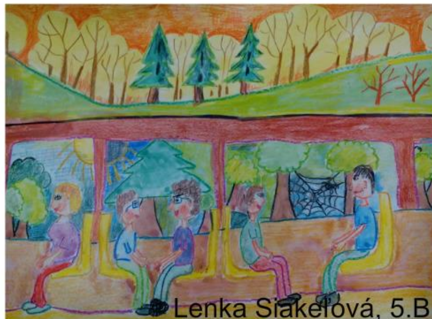
Lenka Siakelová, 5.B