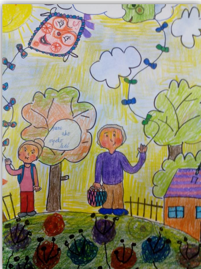
Nakreslila: Sarah Galbová, 5.A